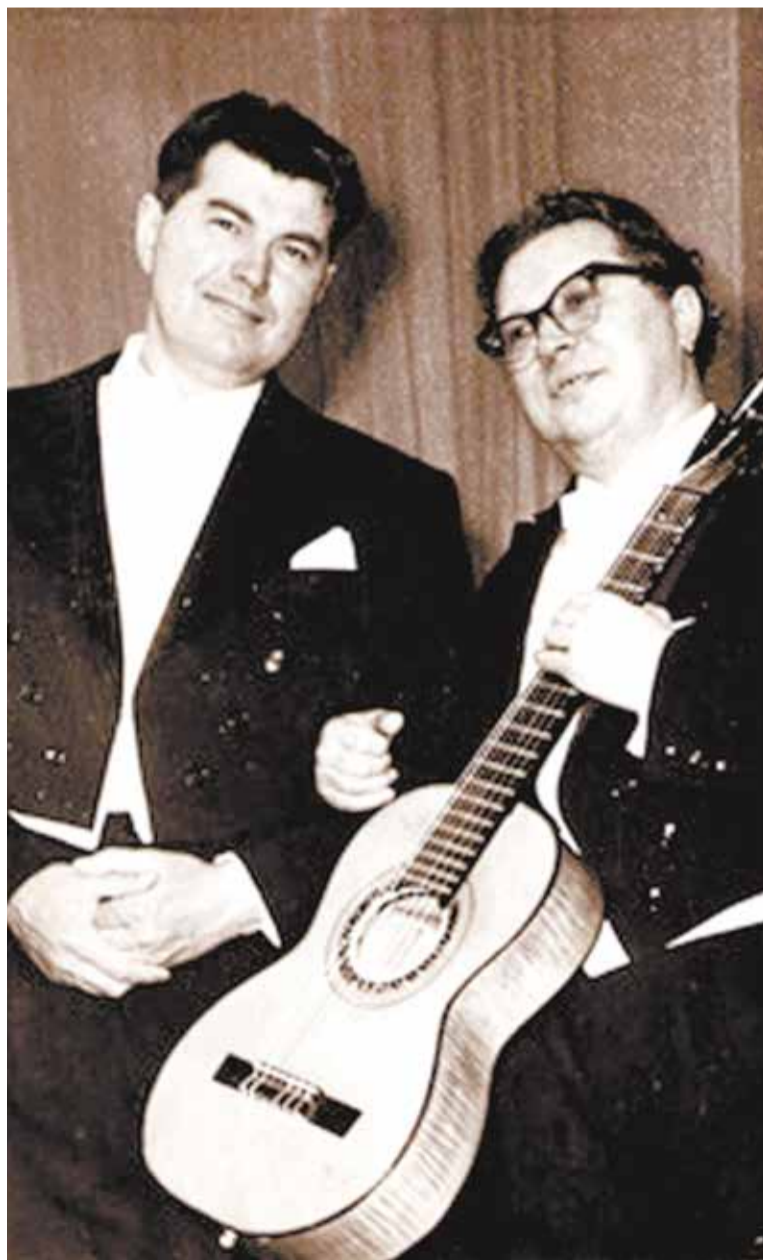
Штоколов с аккомпаниатором