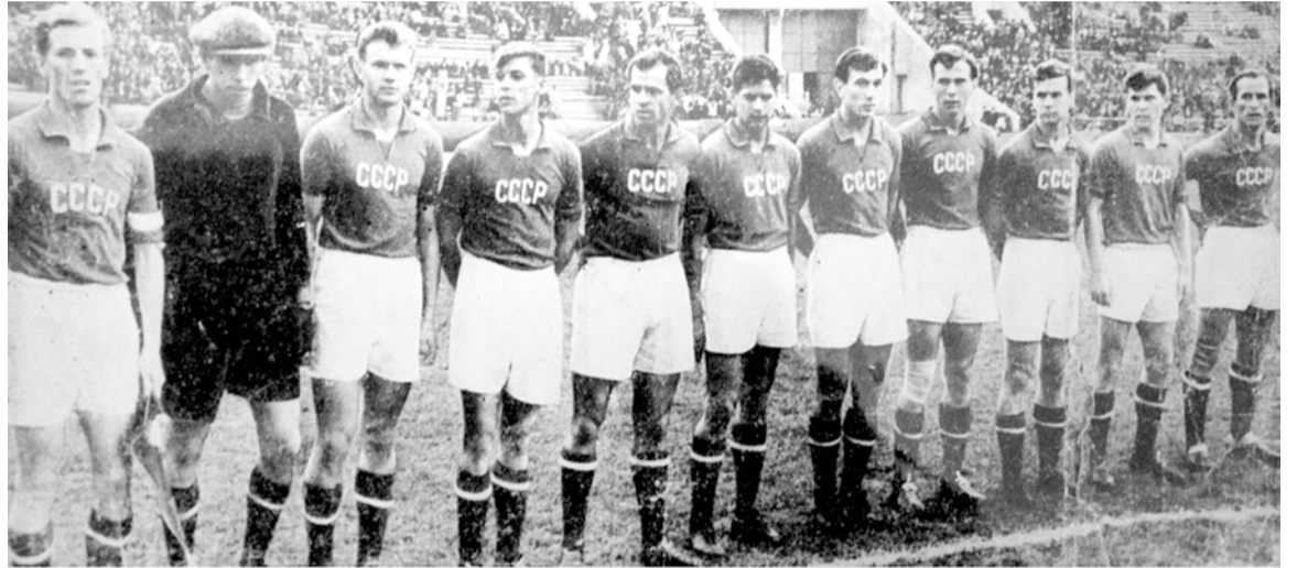
Футбольная команда СССР, занявшая 1-е место на III дружеских играх