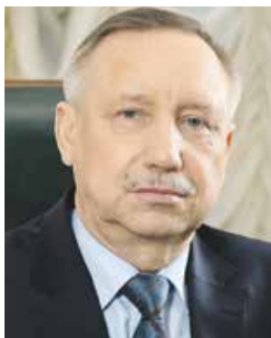
Александр БЕГЛОВ, губернатор Санкт-Петербурга