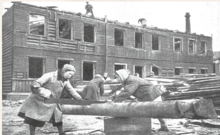
Разборка деревянных зданий на топливо. 1942 год

– В начале сентября 1941 года 9 вражеских самолетов, державших направление в сторону совхоза, разбомбили Новодеревенский рынок. Было убито и ранено множество людей. В тот день на центральную усадьбу совхоза «Красная заря» было сброшено 22 бомбы. Разрушены здание конторы, красный уголок, хозяйственные постройки, кузница.