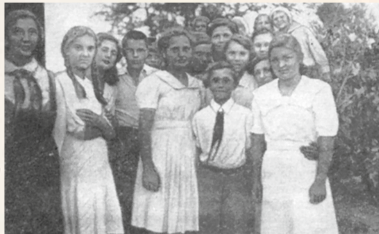
В школьном лагере совхоза «Красная заря»

– Интересный факт: в обороне приморских рубежей