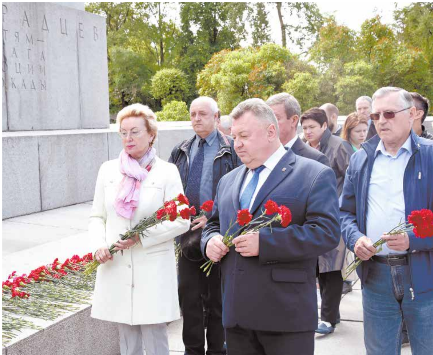
Помним. Скорбим. Гордимся

Мы в вечном, неоплатном долгу перед ними. И ныне живущие, и наши потомки.