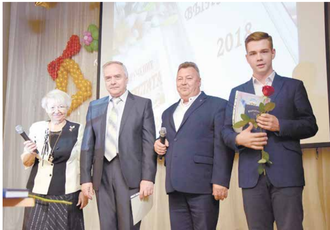
Путевка в жизнь – заслуга и педагогов, и родителей выпускников

Хочется пожелать нашим выпускникам пронести школьную дружбу через всю жизнь. Чтобы школьные стены оставались родным домом еще на долгие годы. И, конечно же, выбрать дальнейший жизненный путь, прочный фундамент которого был заложен прекрасными, талантливыми педагогами наших школ и гимназий.