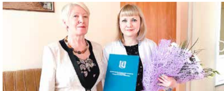
НАШИ ЛУЧШИЕ МЕДИЦИНСКИЕ РАБОТНИКИ БЫЛИ НАГРАЖДЕНЫ ПОЧЕТНЫМИ ГРАМОТАМИ МО ЧЕРНАЯ РЕЧКА

День медицинского работника – отличный повод еще раз выразить признательность и благодарность людям в белых халатах за их подвижническое беззаветное служение на поприще медицины. И это не только лишь врачи, но и лаборанты, инженеры – создатели медицинского оборудования, химики и биологи, которые исследуют различные штаммы вирусов и бактерий. Многие другие профессионалы с большой буквы.