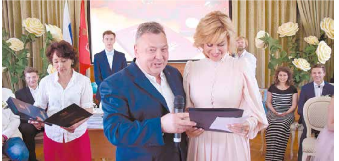
Гимназия № 631 – одно из лучших средних учебных заведений Санкт-Петербурга

Тем, кто переступил школьный порог, кажется, что «не надо печалиться, вся жизнь впереди». Но ведь на самом деле время течет очень быстро. Понимание этого приходит с годами. Умение управлять временем – великое искусство. Ежедневник – первый шаг в овладении им.