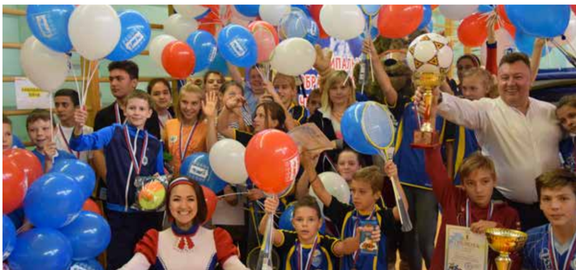
Яркий спортивный праздник!

Прыжки со скакалкой и прыжки в длину, отжимания, подтягивания и броски баскетбольного мяча в сетку – вот основные спортивные дисциплины Спартакиады. Завершающим этапом стали такие испытания, как «Гусеница», «Мегалодка», «Лыжи». И это были, пожалуй, самые азартные, самые веселые моменты. С таким же азартом ребята болели за своих, переживали за их промахи, радовались успехам. Один за всех, все за одного! Отличный пример воспитания командного духа, коллективизма.