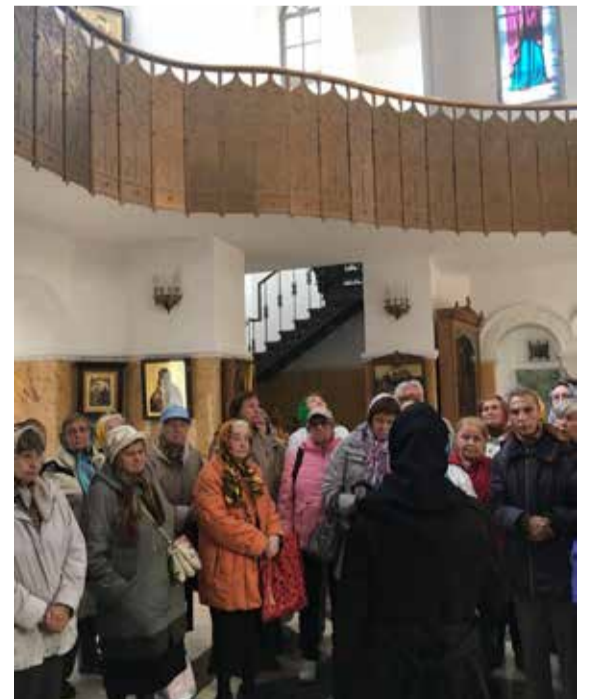
Здесь особая духовная аура и отрешенность от суетного мира

Строительство храма началось двадцать лет тому назад – в 1998 году.