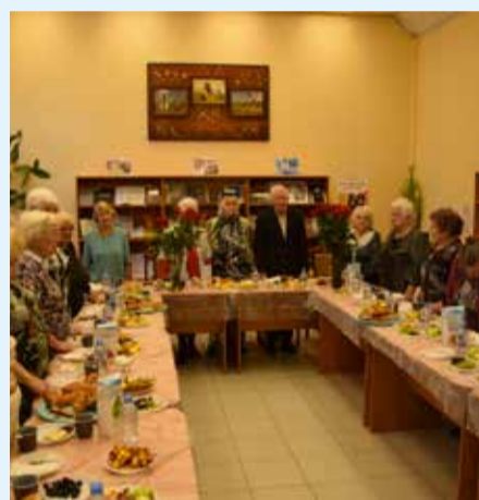
Минута молчания в память жертв Ленинградской блокады

20 сентября в библиотеке № 2 имени Д. Фурманова, расположенной на набережной Черной речки, 12 состоялось чаепитие для наших дорогих ветеранов-блокадников.