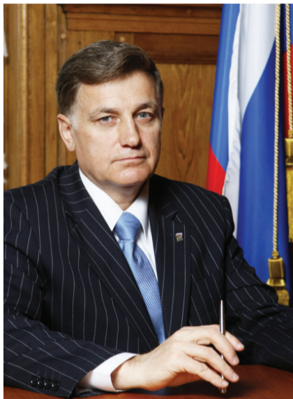
Макаров Вячеслав Серафимович Председатель Законодательного собрания Санкт-Петербург

Официальное издание Муниципального округа Черная Речка