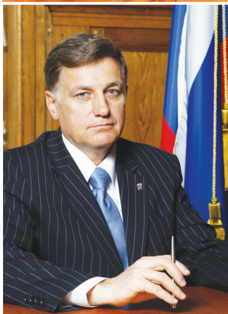
Председатель Законодательного Собрания Санкт-Петербурга В. С. МАКАРОВ

Дорогие ленинградцы-петербуржцы! Дорогие ветераны, жители блокадного Ленинграда! Сердечно поздравляю вас с 70-й годовщиной Победы в Великой Отечественной войне!