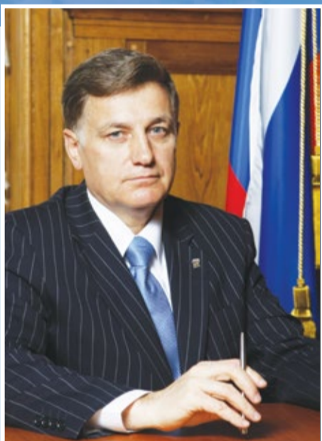
Председатель Законодательного Собрания Санкт-Петербурга В. С. МАКАРОВ