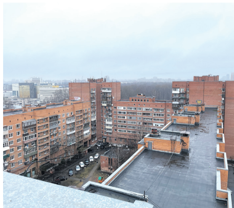
Современный вид (фото с крыши 1-го подьезда)

Сколько за прошедшие годы в доме произошло событий! В 90-е были бандитские разборки в кафе на улице Школьной, в парадных