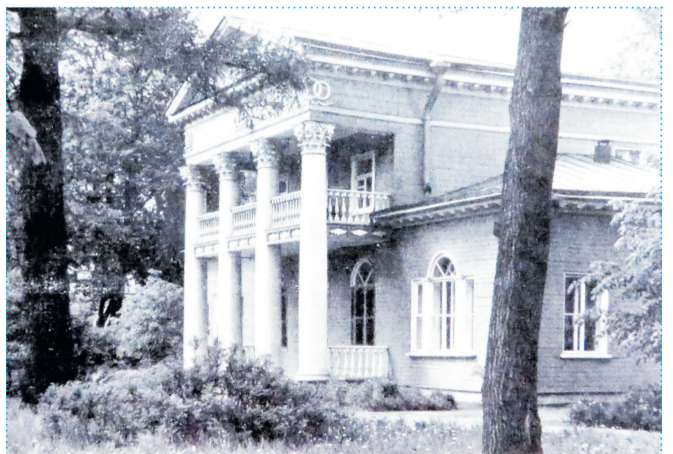
Дача Шишмарёвых. Фото начала XX века

В глубине тихого сада на Приморском проспекте спрятана небольшая старинная усадьба – дача Шишмарёвых , уникальный памятник архитектуры XIX века . Дача Шишмарёвых – единственная из всех деревянных построек архитектора А. И. Мельникова , которая сохранилась до наших дней . Ее история весьма любопытна.