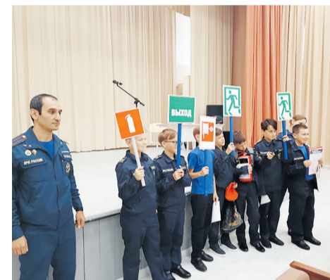
Управление по Приморскому району ГУ МЧС России по СПб

После урока с воспитателями школы был проведен дополнительный противопожарный инструктаж. Воспитанникам школы также напомнили номера вызова экстренных служб, а чтобы они не забывались, вручили памятки по пожарной безопасности.