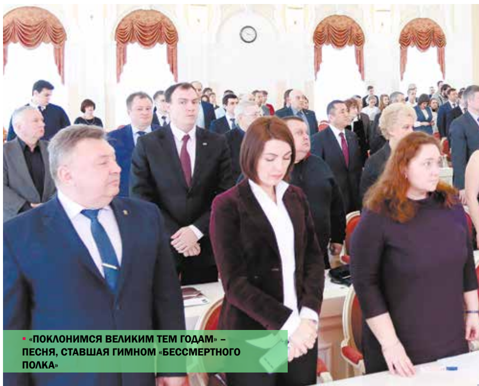
• «ПОКЛОНИМСЯ ВЕЛИКИМ ТЕМ ГОДАМ» – ПЕСНЯ, СТАВШАЯ ГИМНОМ «БЕССМЕРТНОГО ПОЛКА»

29 марта в Правительстве Санкт-Петербурга , в Световом зале Смольного состоялась третья региональная конференция общероссийского общественного гражданско-патриотического движения «Бессмертный полк России» с расширенным составом участников.