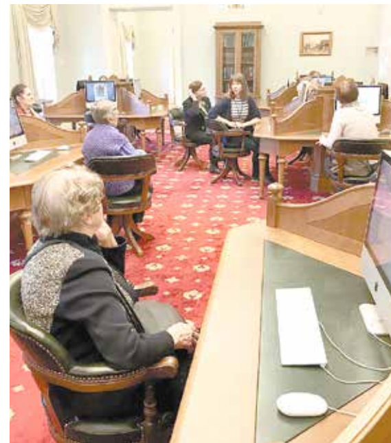
• СОКРОВИЩНИЦА ЗНАНИЙ В НОВОМ ФОРМАТЕ

Открытие этой библиотеки, размещенной в историческом здании Синода, ознаменовало новый этап развития библиотечного дела в нашей стране. А нам, петербуржцам, очень важно, что любимый город, благодаря этому учреждению, вновь подтверждает звание культурной столицы России. Такое мнение единодушно высказали наши экскурсанты.