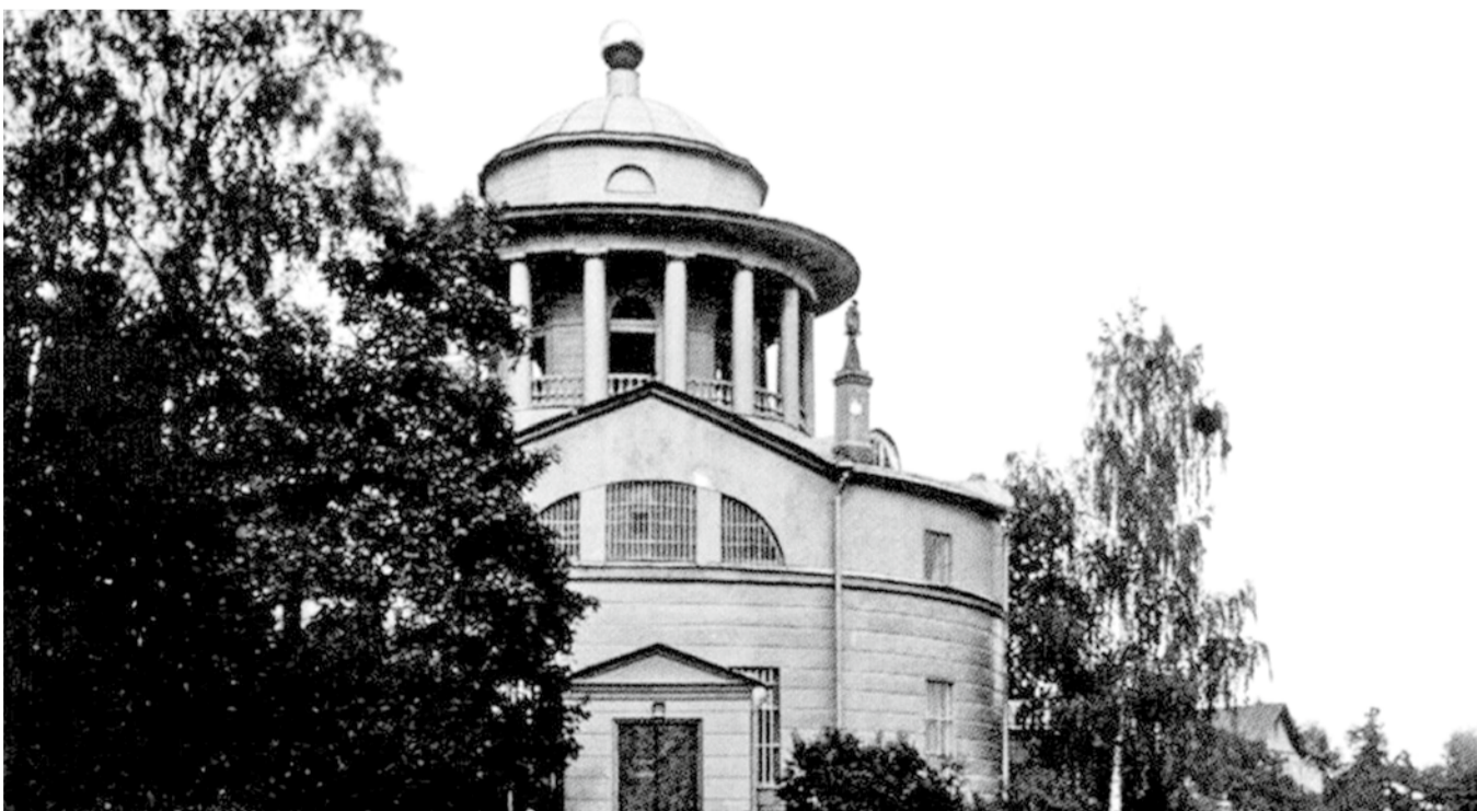
Церковь Благовещения Пресвятой Богородицы. Фото 1900-х годов

Сегодня Благовещенская церковь всегда открыта для прихожан. Для молодежи при храме проводятся воскресные богословско-философские встречи клуба «Современник». Каждый год, 7 апреля, в праздник Благовещения Пресвятой Богородицы, митрополит Санкт-Петербургский и Ладожский совершает здесь Божественную литургию. Это уже стало доброй традицией.