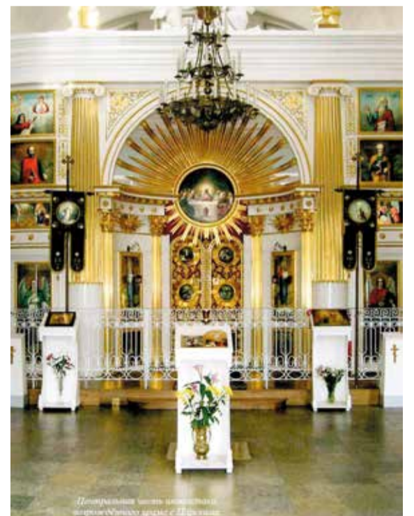
Иконостас Благовещенской Церкви