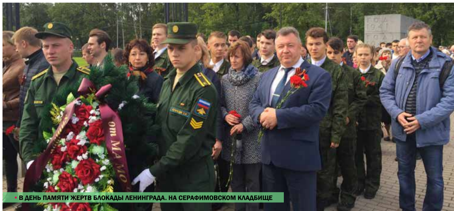
В ДЕНЬ ПАМЯТИ ЖЕРТВ БЛОКАДЫ ЛЕНИНГРАДА. НА СЕРАФИМОВСКОМ КЛАДБИЩЕ

Бесспорно, участие в таких мероприятиях закладывает основы патриотизма и пробуждает гордость за свою страну. В День памяти жертв блокады Ленинграда мы низко склоняем головы перед подвигом погибших, перед всеми, кто положил свои жизни на алтарь великой победы и сердечно благодарим наших дорогих блокадников и воинов-ветеранов, защищавших Ленинград. Подвиг ленинградцев переживет века и навсегда останется в наших сердцах. ■