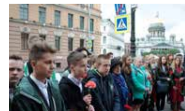
ВОЗЛОЖЕНИЕ ЦВЕТОВ У ПАМЯТНОЙ ДОСКИ НА ЗДАНИИ МАРИИНСКОГО ДВОРЦА

Мы должны помнить и о том, что в самый критический момент битвы за Ленинград на фронт пошли дивизии Народного ополчения. Люди разного возраста, среди которых были ученые, композиторы, учителя, инженеры, рабочие, явили невиданный