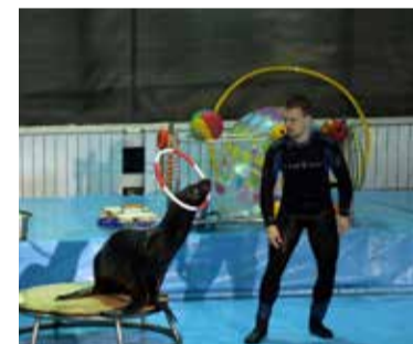
• ДЕЛЬФИНАРИЙ ДЛЯ ПЕРВОКЛАШЕК

«Очень важно, чтобы школьная пора начиналась для детей с интересного и запоминающегося события. Каждый год мы приглашаем учеников первых классов и их родителей в дельфинарий. Это стало доброй традицией. Первоклассники с огромным удовольствием наблюдают за шоу в исполнении морских животных.