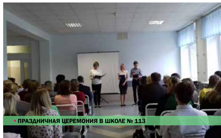
• ПРАЗДНИЧНАЯ ЦЕРЕМОНИЯ В ШКОЛЕ № 113

ли молодых учителей, только вставших на учительскую стезю сразу после окончания вуза. В празднике приняли участие и студенты университета имени Герцена, проходящие в эти дни практику в школе – их веселое представление в духе студенческого «капустника» стало одним из «гвоздей» концертной программы. Приятным сюрпризом стало видеопоздравление, которое подготовили для своих учителей дети.